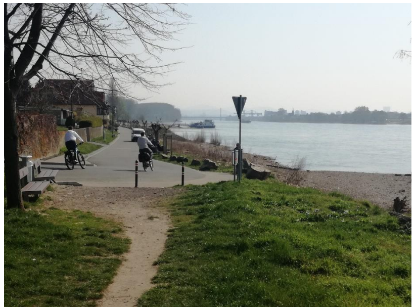
Radeln ist auch zu Corona-Zeiten möglich, sinnvoll und attraktiv – wie hier am Mondorfer Rheinufer.

So ist das Radfahren zwar erlaubt, aber nur allein, zu zweit oder mit der Familie. Das sonst recht umfangreiche Radtourenangebot muss daher leider bis auf weiteres ausfallen. Um diejenigen, die Radeln wollen, aber nicht recht wissen wohin, zu Radeln zu ermutigen, wurden nun zwei Radrunden für Niederkassel erarbeitet. Die Routen von etwas über 20 km Länge können selbstständig in 1,5 bis 2 Stunden nachgeradelt werden. Beide Runden starten in Niederkassel am Rathaus und führen weitestgehend über asphaltiert Wege und Straßen mit