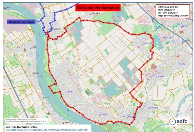
Südrunde über Rheidter Werth, Mondorfer Hafen, Diescholl und Rotter See.