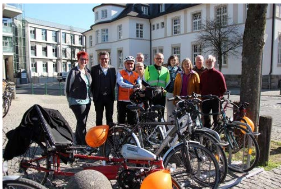
Vor der Post wurde die erste Abstellanlage von Bürgermeister und ADFC eingeweiht.