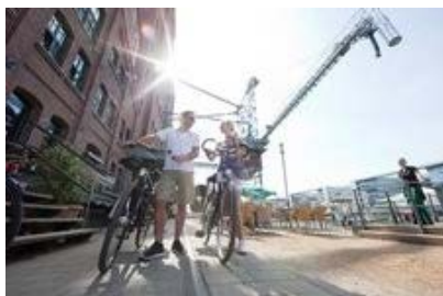
Innenhafen in Duisburg

Vorjahr einen Platz gutmachen konnte und sich die "Silbermedaille" nun mit dem Weser-Radweg teilt.