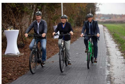
Bundesministerin Schulze eröffnet ersten deutschen Solarradweg.