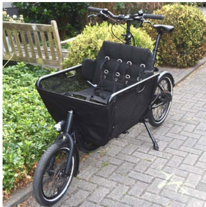
Ausleihbares Lastenrad "Projekt Bolle Bonn"