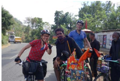
Radreise durch Südindien

Natürlich können Sie auch einfach vorbeischaun, um endlich für "Aufbruch Fahrrad" zu unterschreiben.