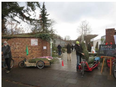
Co2-freier Weihnachtsbaumtransport mit Bolle