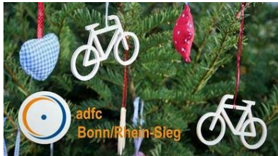
Es weihnachtet beim ADFC.