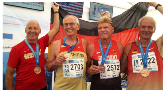
Gewinnerteam Bronze bei der WM in Malaga.

Neun begeisterte Bonner RadfahrerInnen nehmen in der kommenden Woche die nächste