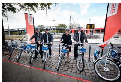
Start des Fahrradmietsystems Bonn

Hier ein Link zur ausführlichen Würdigung und der Pressemeldung des ADFC.