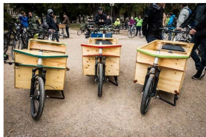
Die ersten Räder der Velowerft sind fertig!