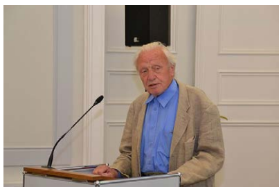
Karl-Ludwig Kelber © ADFC NRW