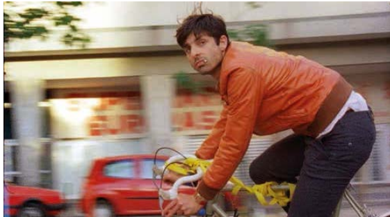
"The Bicycle"