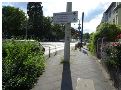
Kreuzung Reuterstraße/Bonner Talweg