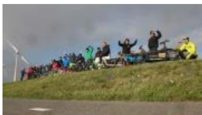
"Schokofahrt 2018"

Welche Maßnahmen ergriffen wurden, um als fahrradfreundlicher Arbeitgeber zertifiziert zu werden sowie interessante Details drumherum, können Sie dieser ADFC-Pressemittelung entnehmen.