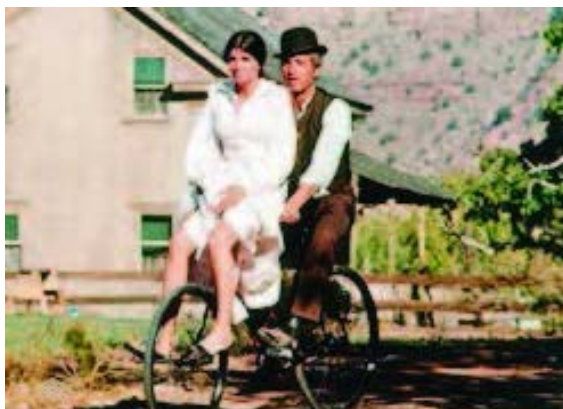
"Butch Cassidy and the Sundance Kid"

> mehr zu "Luftpumpen auf Bonner Schulhöfen"