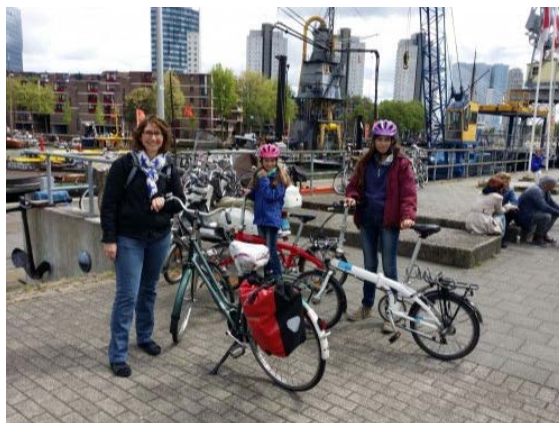
Radeln mit Kindern