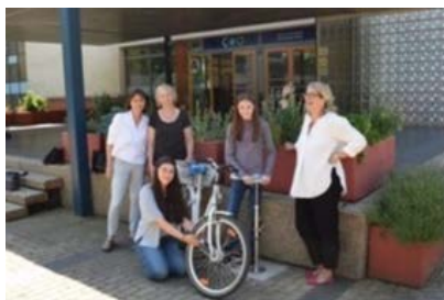
Die 1. neue Pumpe steht am CvO-Gymnasium