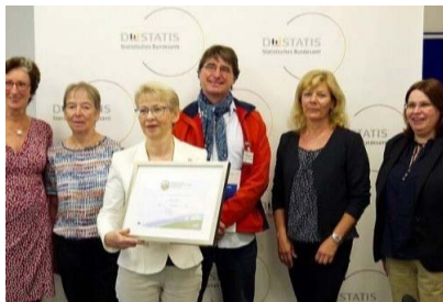
Der ADFC zertifizierte das Statistische Bundesamt als fahrradfreundlichen Arbeitgeber