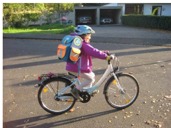
Auf dem Weg zur Schule.

Fast 2.500 Vorschläge wurden von 600 registrierten Benutzern, plus zahlreicher "anonymer" Teilnehmer, im Zeitraum 13. September bis 18. Oktober unter www.raddialog.bonn.de eingetragen. Die Meldungen, Kommentare, Bewertungen können