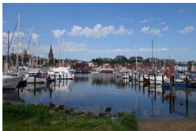
Kristiansand, Südnorwegen