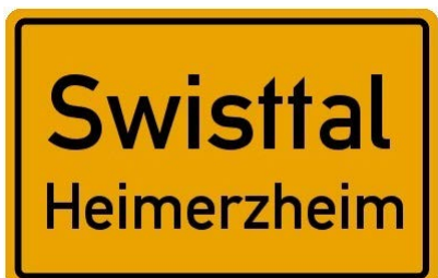
Nach Heimerzheim radeln - nur auf der Landstraße?

Offen für alle ist weiterhin der Schraubertreff "Bier und Bike" jeden 3. Donnerstag im Monat ab 20 Uhr.