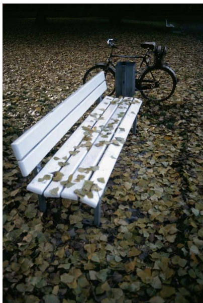
Unterwegs im Herbst.