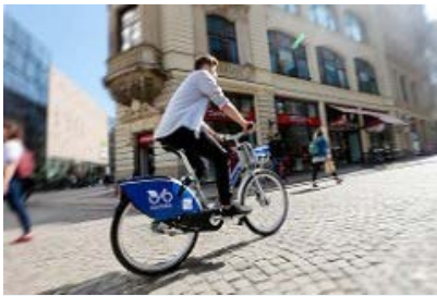
Jetzt auch in Bonn zu mieten: 900 Leihräder in vielen Stadtteilen.

eingeweiht, inzwischen können 900 Räder im ganzen Stadtgebiet per App ausgeliehen und auch flexibel wieder abgestellt werden.