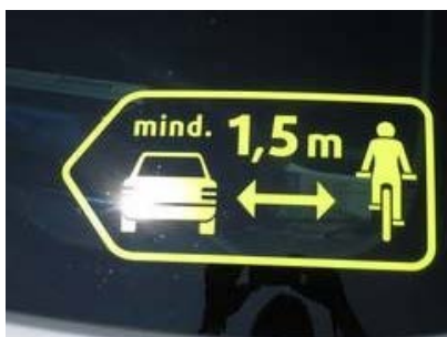
Abstand-Aufkleber @ S. Krämer-Kox