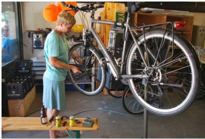
ADFC-Werkstatt: Hier macht das Schrauben Freude.

Genauere Infos zur Einführung und Nutzung gibt es auf unserer Webseite und bei nextbike .