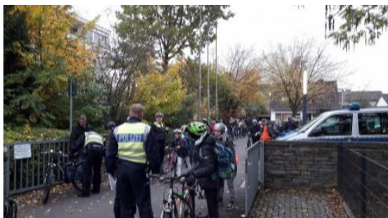
Großes Aufgebot bei der Lichtaktion