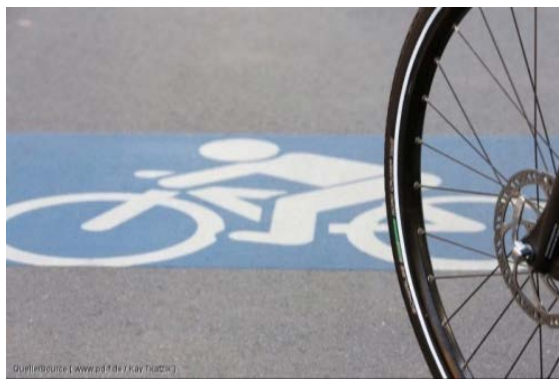
Für gute Radwege im Rhein-Sieg-Kreis