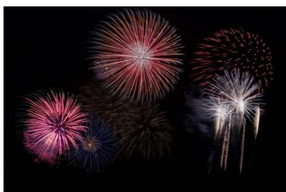
Wir sind jetzt 6000 !