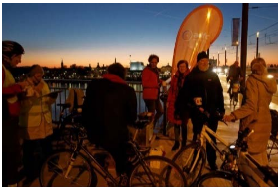
Abendstimmung beim Brückenpunsch 2018