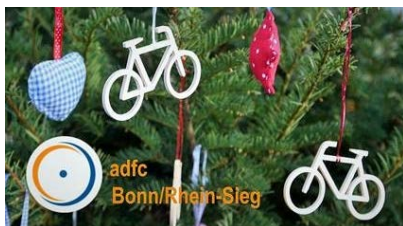
Es weihnachtet beim ADFC.