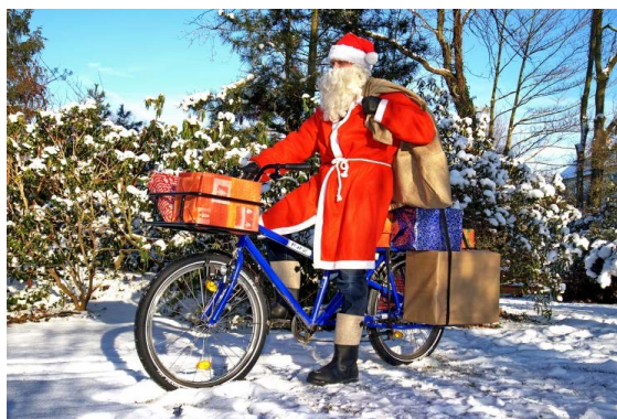
Tolle Geschenkideen vom ADFC-Weihnachtsmann.

Im Haus des ADFC-Bonn/Rhein-Sieg (Breite Str. 71) hat es im November gebrannt, das