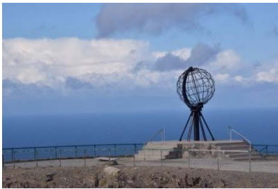
Der lange Weg zum Nordkap

Dänemark, Schweden, Finnland und Norwegen zum Kap.