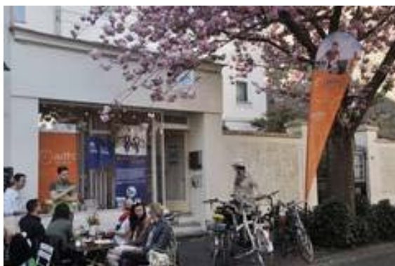
Das RadHaus vor dem Brand.

Alle Jahre wieder, wenn der Bonner Weihnachtsmarkt kommt, müssen die Fahrradabstellanlagen auf dem Münsterplatz weichen. So weit, so nachvollziehbar. Weniger Verständnis haben wir aber dafür, dass das Bonner Marktamt dies lapidar per Pressemeldung und Aushangsschilder verkündet, sich aber keine Gedanken über Alternativen macht. Auf unsere Nachfrage hin, wurden wir auf 2018 vertröstet. Doch dem Fahrradteam der Stadt Bonn - das wir mit eingeschaltet hatten - ist zu verdanken, dass pünktlich zum 1. Advent doch mobile Fahrradständer rund um den Weihnachtsmarkt aufgestellt wurden. Die Standorte: Windeckstraße - vor dem Torbogen des Alten Stadthauses, am Mülheimer Platz rechts vom Eingang zum Haus der Bildung und In der Sürst (Nähe Martinsbrunnen). Unser Dank an das Fahrradteam (nicht nur weil es weihnachtet) und unser Hinweis an das Marktamt: Am 23. November 2018 beginnt der nächste Weihnachtsmarkt, bitte rechtzeitig die Fahrradständer einplanen.