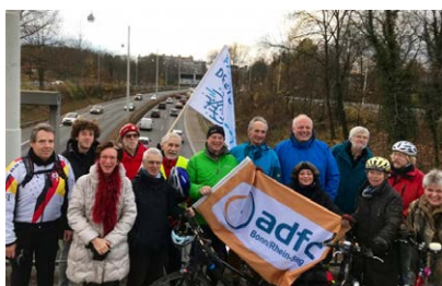
Pressetermin am Tausendfüßler.