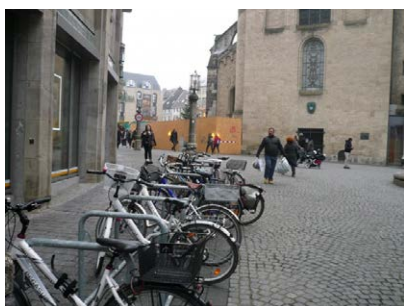
Parken am Bonner Weihnachtsmarkt.