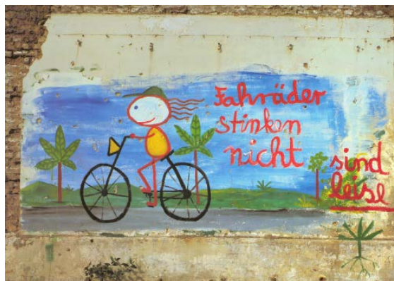
aktuell wie nie: Graffiti von 1979