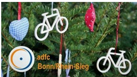
Es weihnachtet beim ADFC.