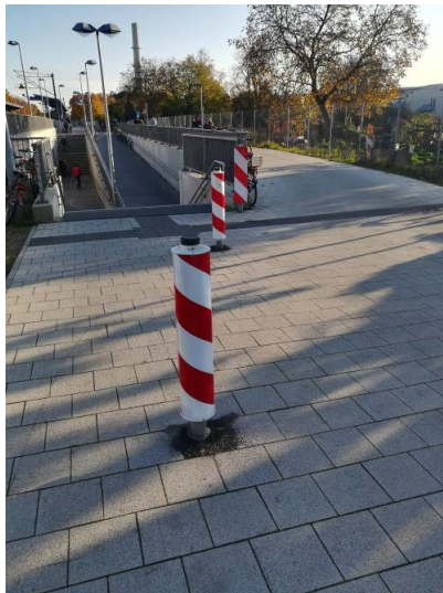
Warnbaken am UN-Campus