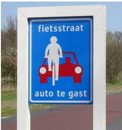
Fahrradstraße in den Niederlanden