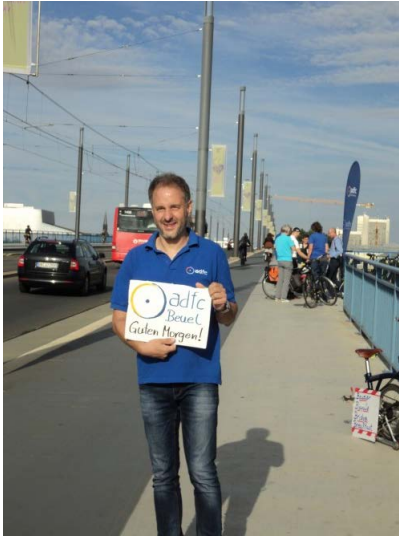
Über immer mehr Radfahrende auf der Kennedy-Brücke freut sich auch der ADFC Beuel. Aktive laden zur Kaffeepause ein.