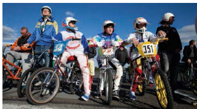
"Mann im Spagat"