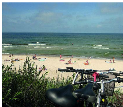
Radeln an der polnischen Ostsee

> mehr zur Führungsspitze und Stellenausschreibung