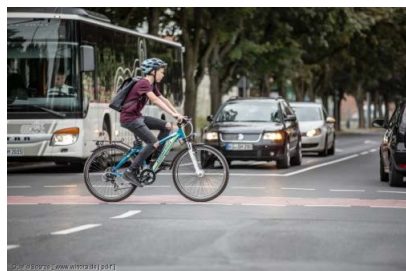
Erzähl uns von Deinem Schulweg mit dem Rad

Achtung - ab sofort größerer Veranstaltungsort für Bildervorträge: Katholisches Bildungswerk, Kasernenstr. 60, Bonn