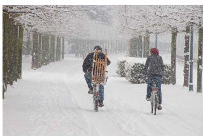
So schön können Wintertouren sein.