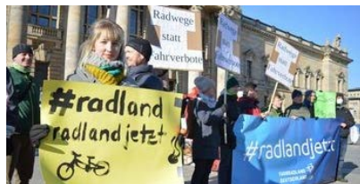
Der ADFC demonstrierte vor dem Bundesverwaltungsgericht in Leipzig.

Wer am Sonntag, 18. März, ein paar Stunden erübrigen kann und teilnehmen möchte, bitte melden unter info@adfc-bonn.de oder 0228-6296364. Wir freuen uns auf Sie!