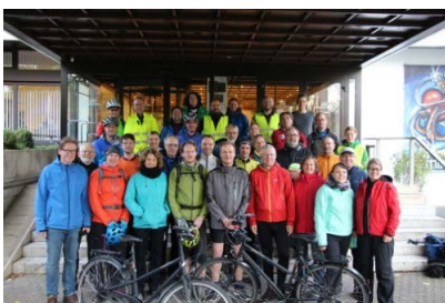
Teilnehmer der ADFC-Exkursion vor dem Maritim Hotel in Gelsenkirchen.