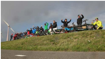
Schokolade auf Reisen.

Mit dem Beitrag endet die Reisevortrags-Saison Herbst/Winter 2017/2018. Jetzt ist wieder die Jahreszeit gekommen, um selbst per Fahrrad neue Gegenden zu erkunden. Von diesen Eindrücken kann dann in der kommenden Vortragssaison berichtet werden..