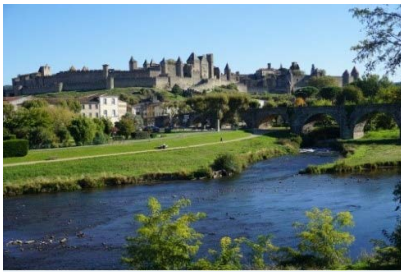
Radeln im Languedoc

Peter Lorscheid bereiste mit Frau und Sohn im Oktober 2016 das Languedoc in Südfrankreich. Die Fahrt ging entlang an Lagunen und Sandstränden am Mittelmeer. Eine Bahnfahrt in die Pyrenäen führte bis auf über 1.500 m Höhe, danach gings runter auf einer eindrucksvollen Abfahrt zur Festungsstadt Carcassonne. Den Abschluss bildete eine beschauliche Radfahrt entlang des Canal du Midi. Peter Lorscheid berichtet am