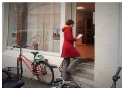
Literaturabend am Weltfrauentag