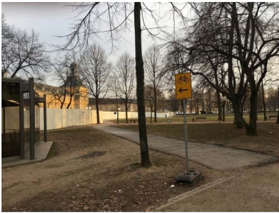
Befestigt und ausgeschildert: Radumleitung an der Hofgartenwiese.