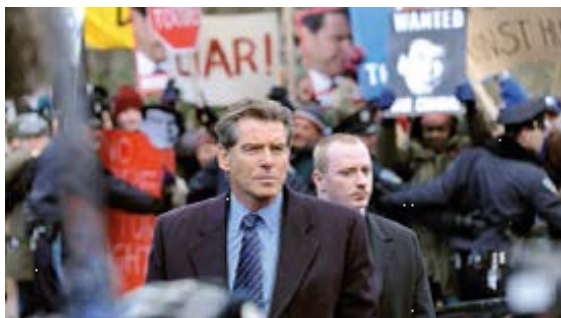
Pierce Brosnan im Film "The Ghostwriter"

Flohmarkt und "pimp-your-bike"-Aktion finden statt am Samstag, 13.4. von 11-14 Uhr am RadHaus, Breite Str. 71.