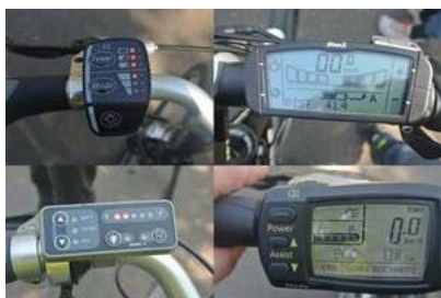
Alles klar oder alles anders? Pedelec-Fahren leichtgemacht