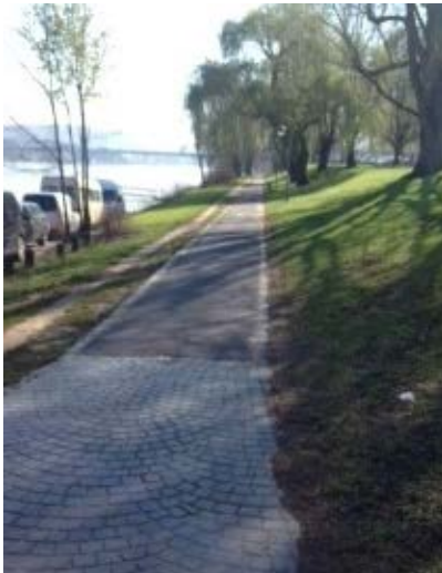
Fahrradweg Rheinaue