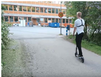
Das Bild zeigt Minister Scheuer auf dem Weg ins Büro