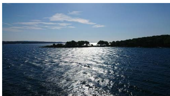
Kroatische Inselwelt.