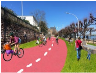
Visualisierung der Radverkehrführung auf Höhe der Schaumburg-Lippe-Str. © Barbara Krausz