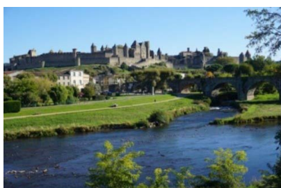
Radeln im Languedoc

PS: Die Rennradfans des ADFC treffen sich mittwochs. Die Termine stehen im Rückenwind und im Internet.