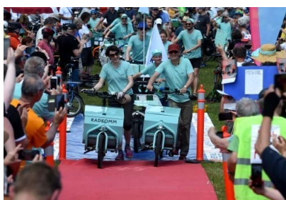
Roter Teppich für 206.687 Unterschriften vor dem Landtag