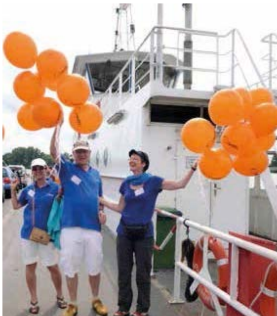
Fähr-Rad-Tag 2019