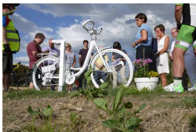
Leider nicht das einzige Geisterrad

diesem Gedenken teilnehmen möchten, treffen sich um 19 Uhr an der Unfallstelle.