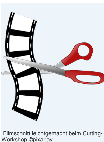
Filmschnitt leichtgemacht beim Cutting-Workshop