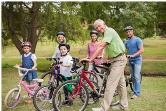
Aktion Stadtradeln

Da insbesondere im Bereich Verkehr in Bonn großer Nachbesserungsbedarf bestehe, haben die beiden Organisationen jetzt mit dem detaillierten Forderungskatalog für den Verkehrssektor nachgelegt. Hier geht es zum Papier .