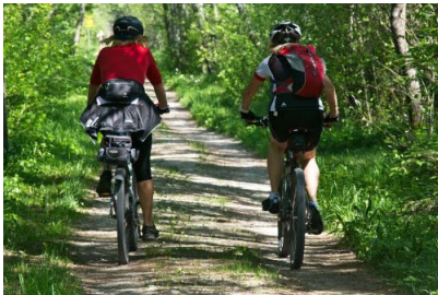
Fahrradtour