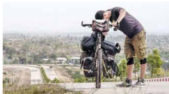
"Besser Welt als nie"