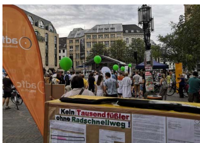
Protest gegen Monsterausbaue und für Radschnellweg am 21. August auf dem Münsterplatz