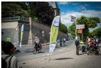
Freie und sichere Fahrt bei der letzten po-up-bikelane-Aktion des Radentscheid