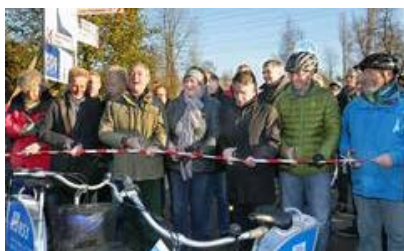
Einweihung RS1 am 27.11.2015

Erster Radschnellweg Deutschlands am Start