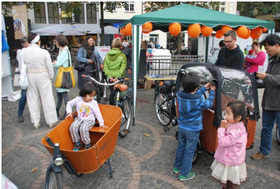
Lastenräder sind spannend.