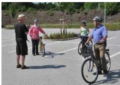
Fahrradschule in Aktion.