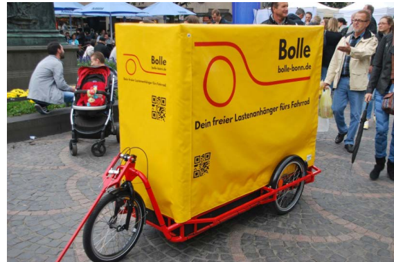
"Bolle" auf dem Radaktionstag.

> mehr zum Fahrradklimatest und zur Rücksichtskampagne