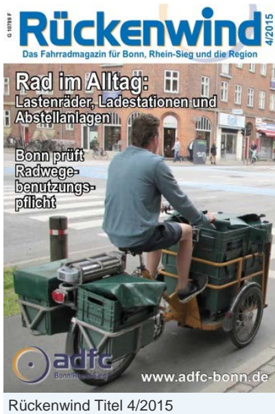
Rückenwind Titel 4/2015