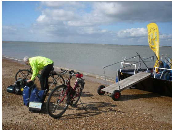
Landung in Südengland.