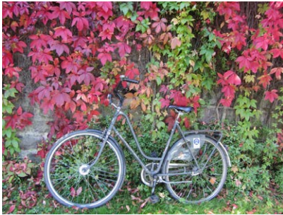
Herbstliches Stilleben.