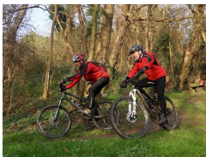
Mit dem Mountainbike auf ADFC-Tour.