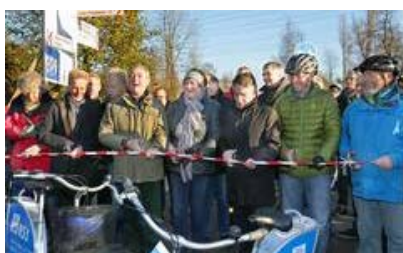
Einweihung RS1 am 27.11.2015

Erster Radschnellweg Deutschlands am Start