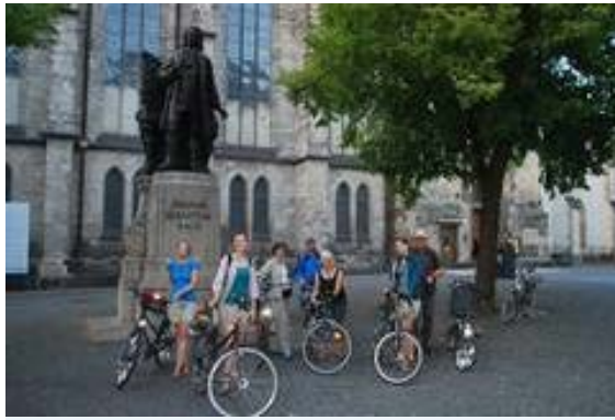
Bach-Denkmal in Leipzig: Bach by Bike.