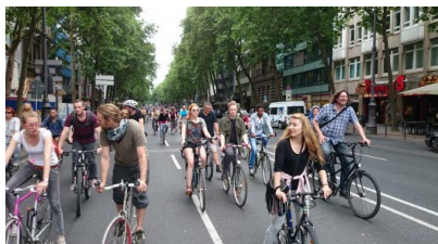
Spontan zur Demo: Critical Mass.