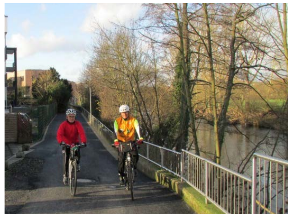
Siegradweg neu asphaltiert.